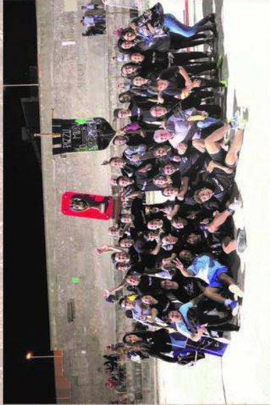
Quartiere Pizzu Muro Vincitore Edizione 2017

Giunto alla sua 33 a edizione, il Palio di San Michele unisce intere generazioni all'insegna della cultura e della tradizione popolare siciliana. Il culmine della manifestazione si ha la sera della sfilata e del "Museo sotto le stelle" dove la rievocazione di usi e costumi dei primi del '900 siciliano, immergono il visitatore in uno scenario unico e suggestivo. "A corsa che scecechi" rappresenta la competizione madre ambita da tutti gli otto quartieri. Si svolge nel corso principale del paese in un percorso di circa 250 mt. e nell'edizione 2017 ha trionfato il quartiere Priuolu con l'asina Valentina, che quest'anno ha partecipato al Palio Internazionale del Casale della Corsa con gli asini piazzandosi quinta su dodici regioni. I tradizionali giochi che si svolgono al campo sportivo vedono sfidarsi gli otto quartieri in competizioni in cui forza e agilità sono il segreto per aggiudicarsi la vittoria del Palio di San Michele. Nella precedente edizione la squadra che ha trionfato è stata quella del quartiere Pizzu Muro.